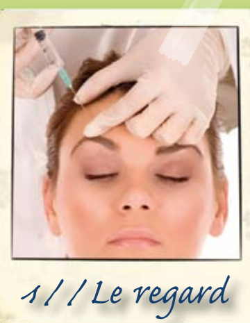
1 // Le regard

Il s'agit d'un mix de communications, de vidéo et de démonstrations en direct.