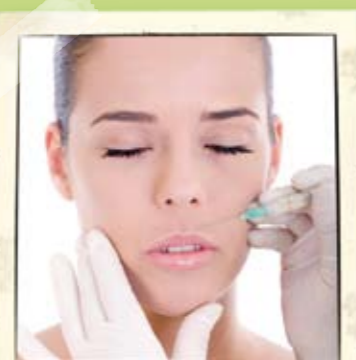
2 // La bouche et le sourire